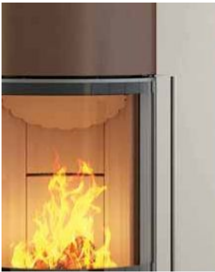
Passo S, Terra Relinggriff in Edelstahl